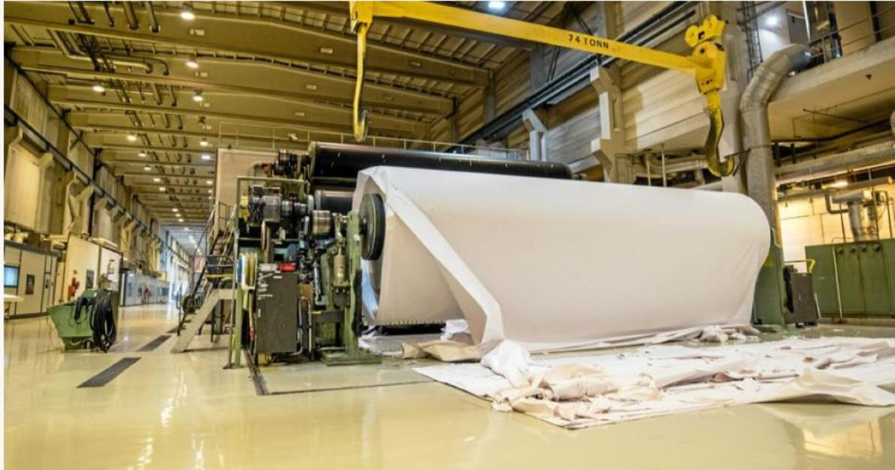
Norske Skog har blitt påvirket av koronakrisen, og har blant annet permittert ansatte i Halden.

Produksjonen på to papirmaskiner på Saugbrugs i Halden er stoppet, mens Tasman-fabrikken i New Zealand er stoppet helt opp.